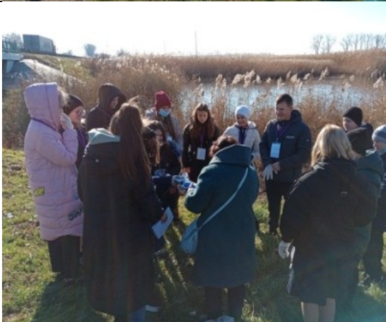
Фотография реализации профориентационной программы 2 день