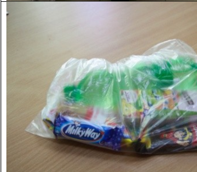
Фотография организации питания и питьевого режима