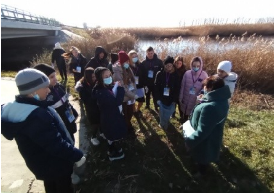
Фотография реализации профориентационной программы 3 день