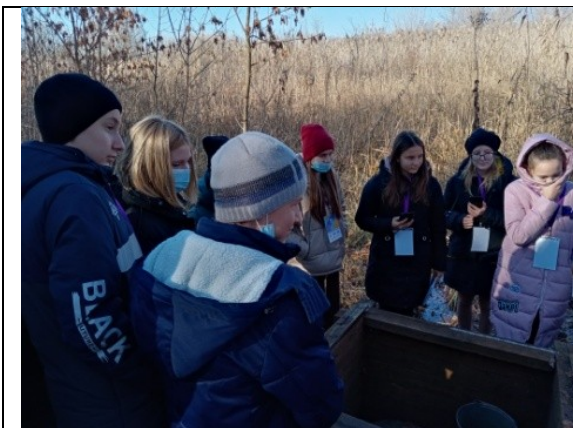
Фотография реализации профориентационной программы 4 день