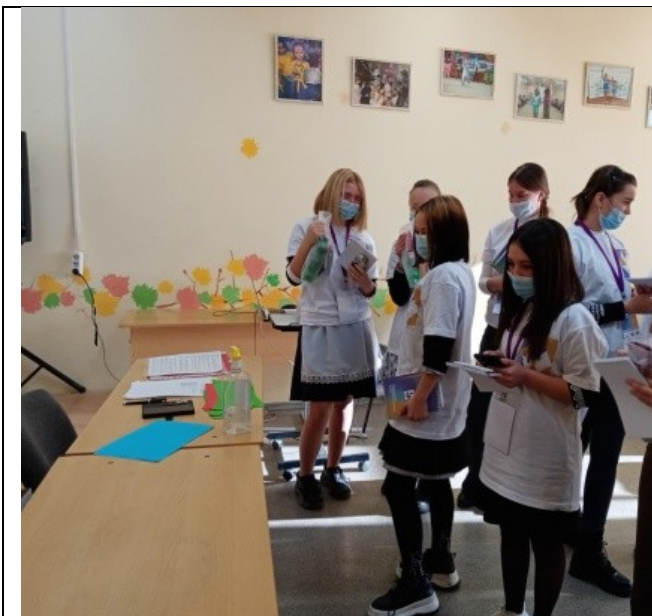
Фотография организации питания и питьевого режима