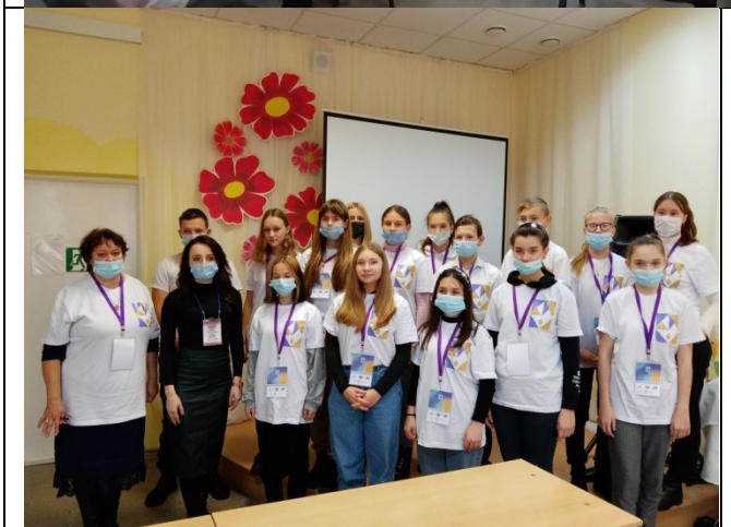
Фотография реализации профориентационной программы 7 день