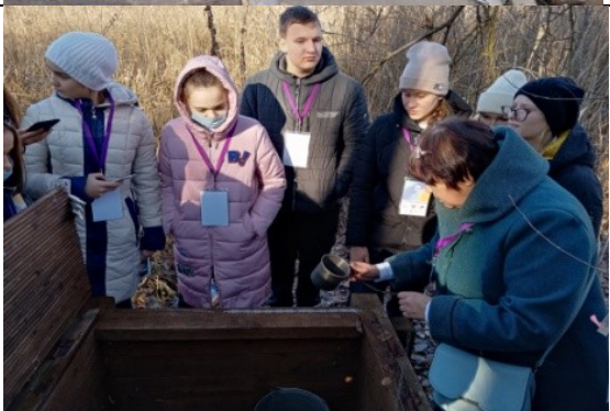
Фотография реализации профориентационной программы 4 день