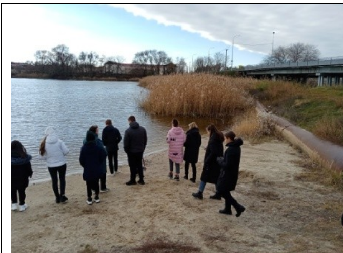
Фотография реализации профориентационной программы 6 день