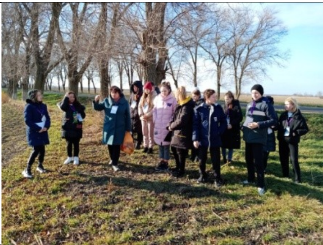
Фотография реализации профориентационной программы 6 день