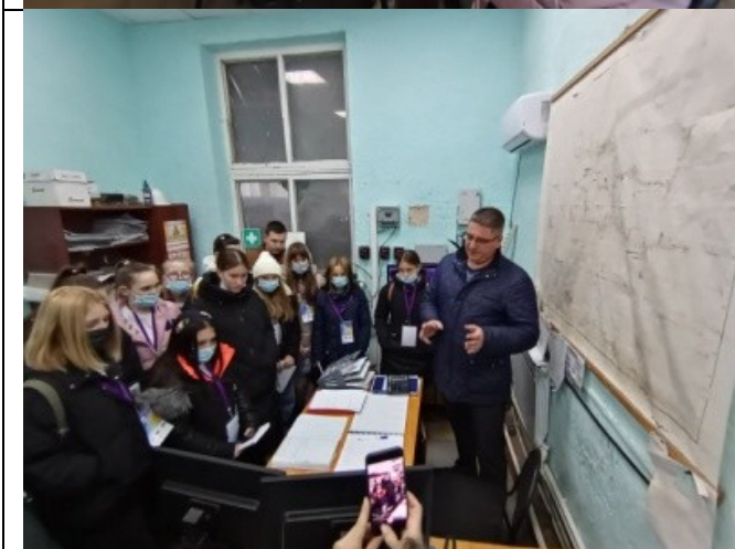
Фотография реализации профориентационной программы 5 день