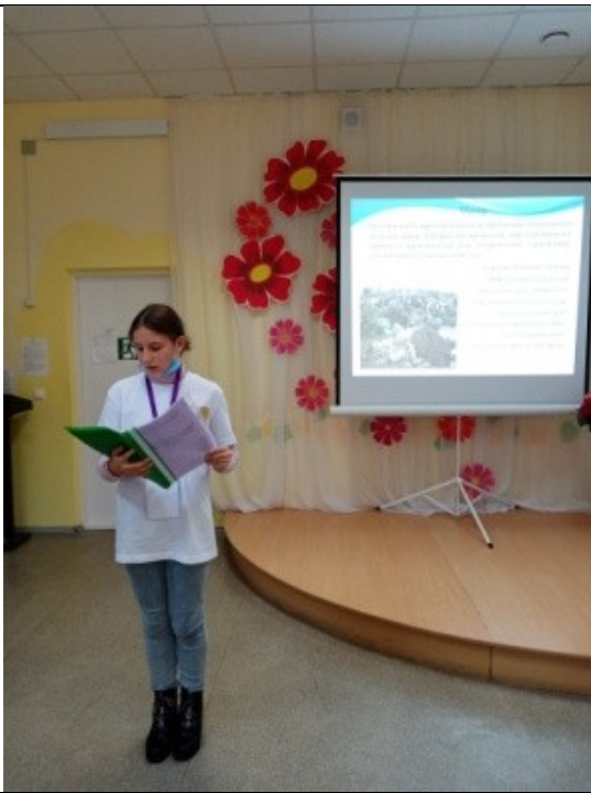
Фотография реализации профорientационной программы 7 день