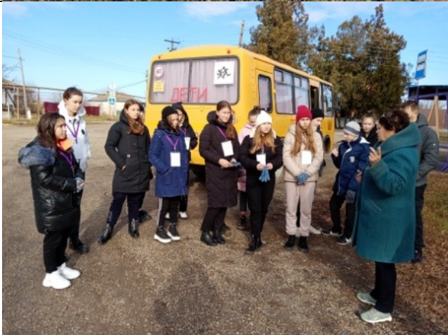
Фотография реализации профориентационной программы 6 день