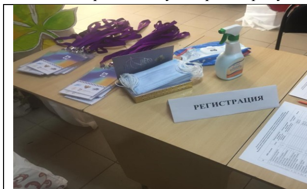
Фотография организации выдачи комплектов расходных материалов /сувенирной продукции

3. Было обеспечено изготовление и выдача каждому участнику и каждомулицу, привлекаемому к осуществлению деятельности, связанной с проведением 7-дневной каникулярной профориентационной школы с дневным пребыванием, комплектов расходных материалов и сувенирной продукции.