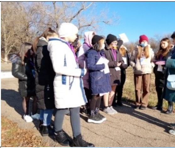
Фотография реализации профориентационной программы 2 день