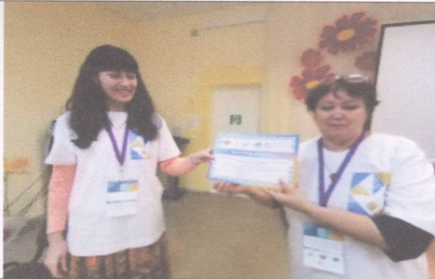
Фотография реализации профориентационной программы 7 день