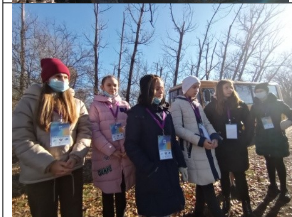
Фотография реализации профориентационной программы 3 день