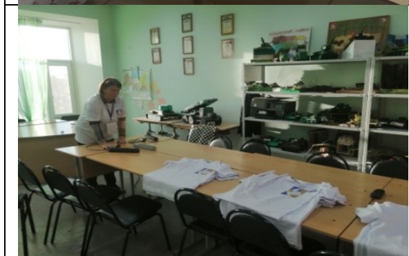
Фотография организации выдачи комплектов расходных материалов /сувенирной продукции