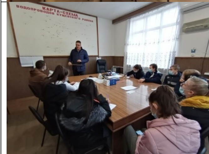
Фотография реализации профориентационной программы 5 день