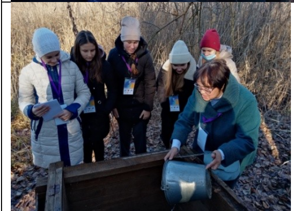
Фотография реализации профориентационной программы 4 день