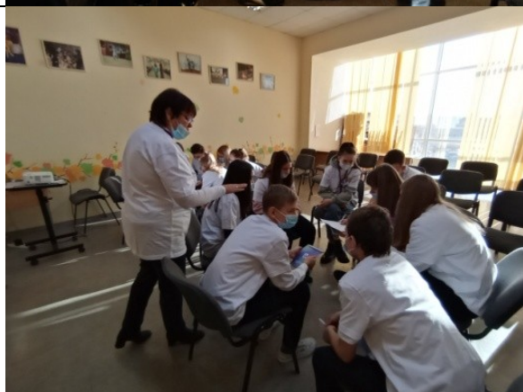
Фотография реализации профориентационной программы 1 день