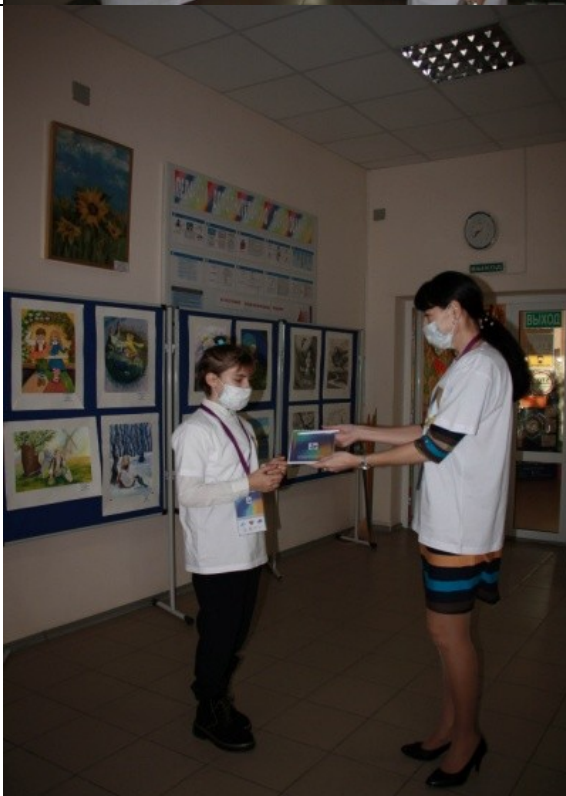
Фотография организации выдачи комплектов расходных материалов /сувенирной продукции