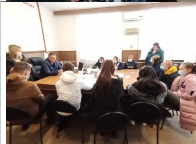
Фотография реализации профориентационной программы 5 день