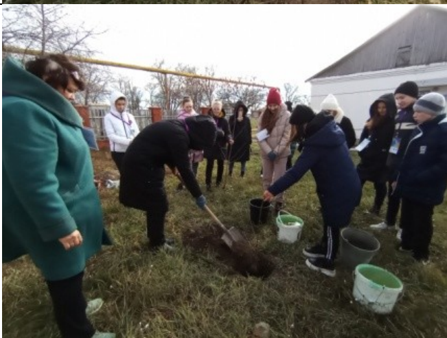
Фотография реализации профориентационной программы 6 день