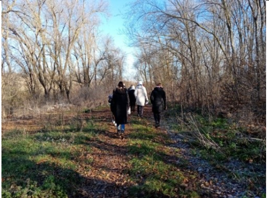
Фотография реализации профориентационной программы 4 день