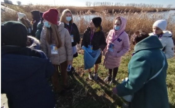
Фотография реализации профориентационной программы 3 день