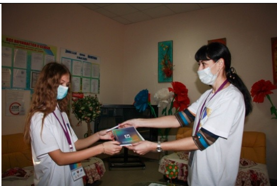
Фотография организации выдачи комплектов расходных материалов /сувенирной продукции