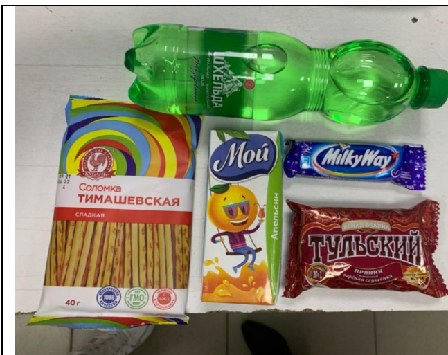
• Фотография организации питания и питьевого режима

2. Участникам 7-дневной каникулярной профориентационной школы было обеспечено питание и питьевой режим: