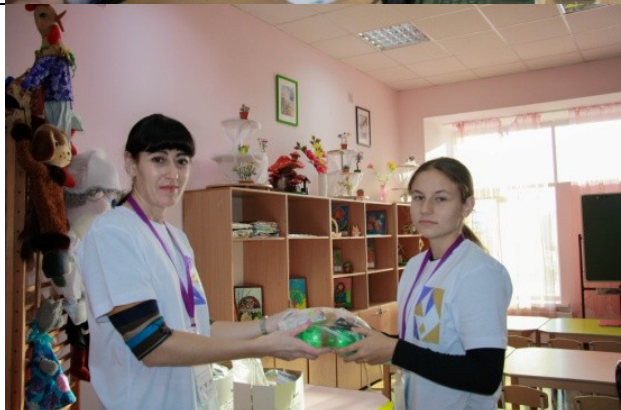
Фотография организации питания и питьевого режима