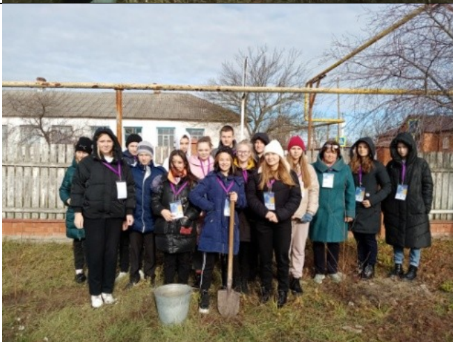
Фотография реализации профориентационной программы 6 день