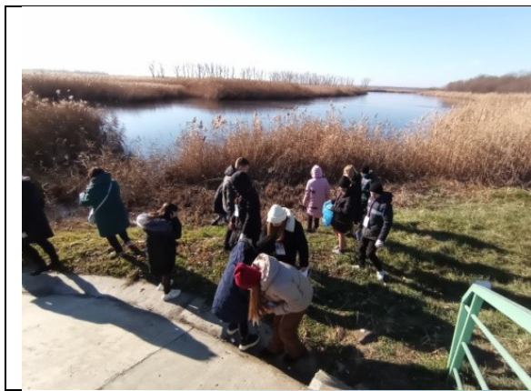
Фотография реализации профориентационной программы 3 день