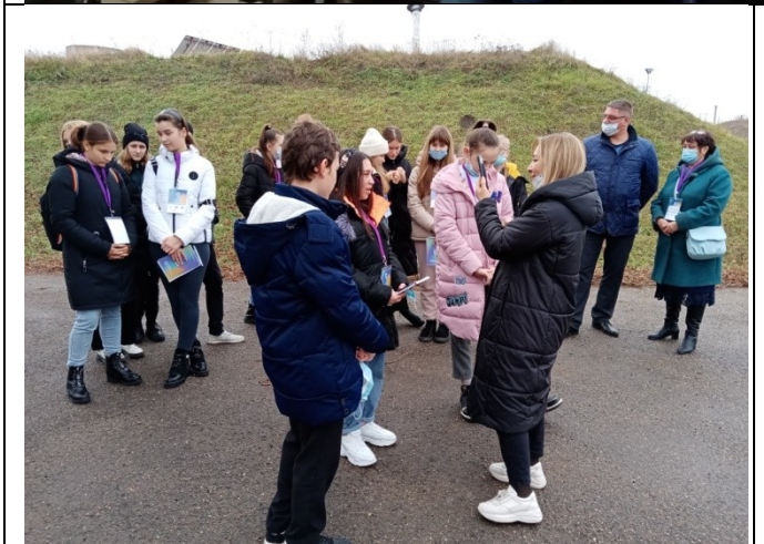
Фотография реализации профориентационной программы 5 день