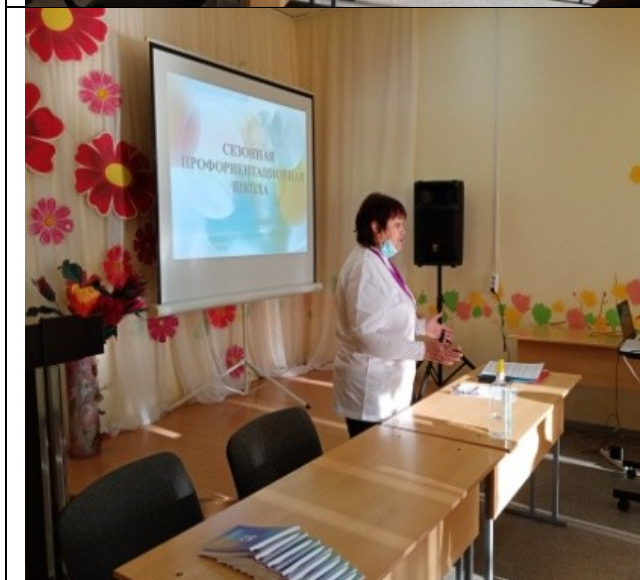
Фотография реализации профориентационной программы 1 день