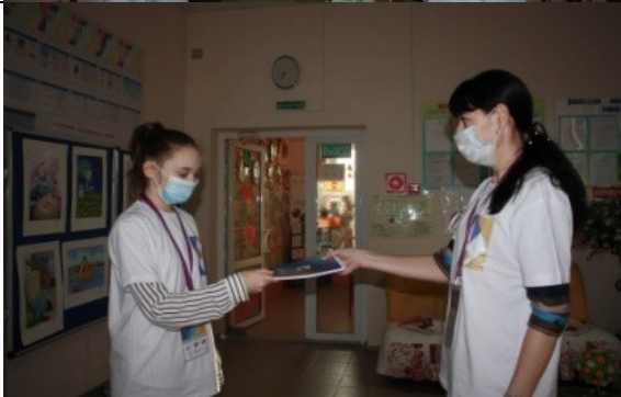
Фотография организации выдачи комплектов расходных материалов /сувенирной продукции