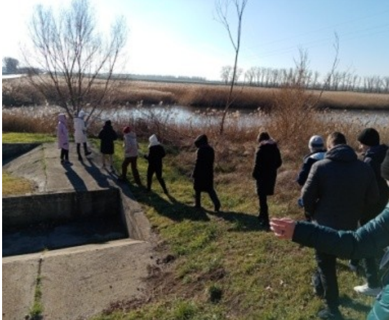
Фотография реализации профориентационной программы 2 день