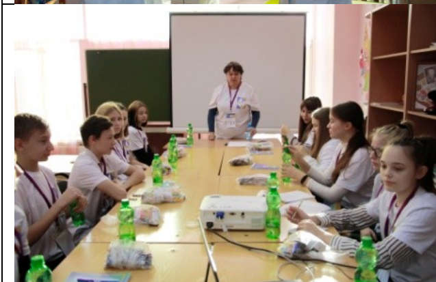
Фотография организации питания и питьевого режима