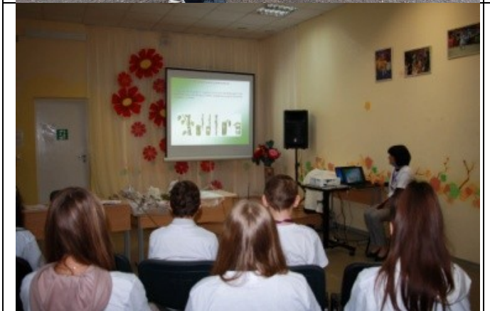
Фотография реализации профориентационной программы 5 день