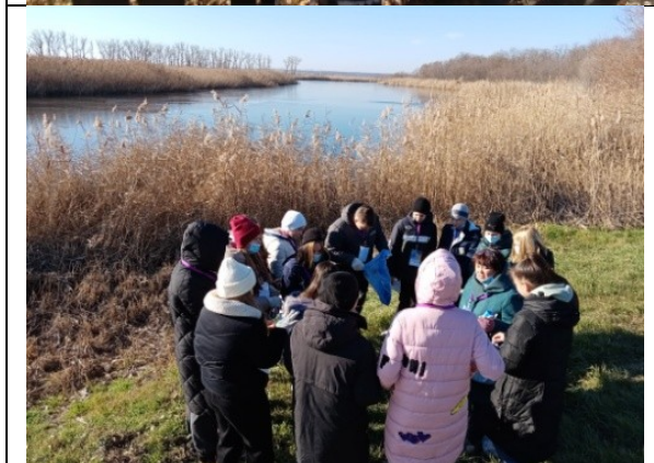
Фотография реализации профориентационной программы 3 день