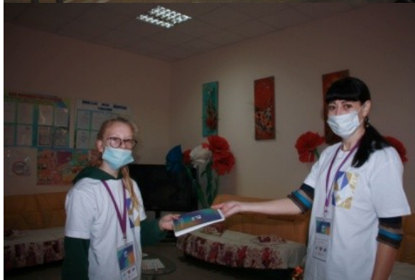
Фотография организации выдачи комплектов расходных материалов /сувенирной продукции