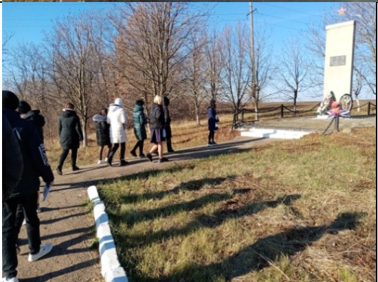
Фотография реализации профориентационной программы 2 день