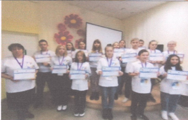
Фотография реализации профориентационной программы 7 день