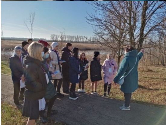
Фотография реализации профориентационной программы 2 день