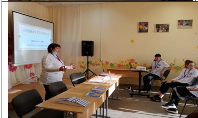
Фотография реализации профориентационной программы 1 день