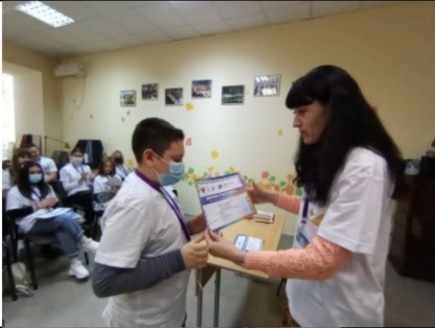
Фотография реализации профорientационной программы 7 день