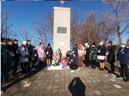
Фотография реализации профориентационной программы 2 день