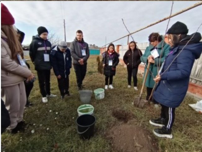
Фотография реализации профориентационной программы 6 день