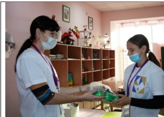
Фотография организации питания и питьевого режима