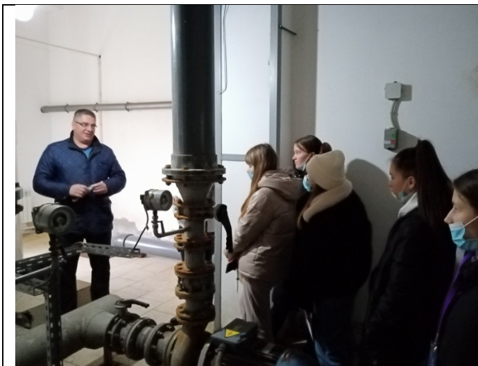
Фотография реализации профориентационной программы 5 день