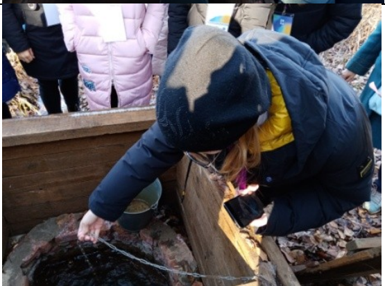
Фотография реализации профориентационной программы 4 день