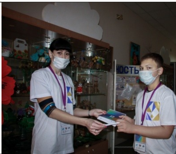
Фотография организации выдачи комплектов расходных материалов /сувенирной продукции