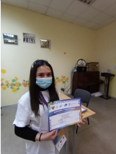
Фотография реализации профорientационной программы 7 день