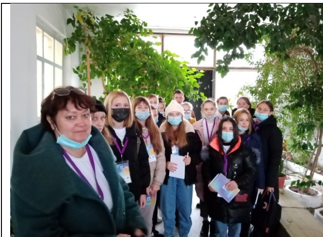
Фотография реализации профориентационной программы 5 день