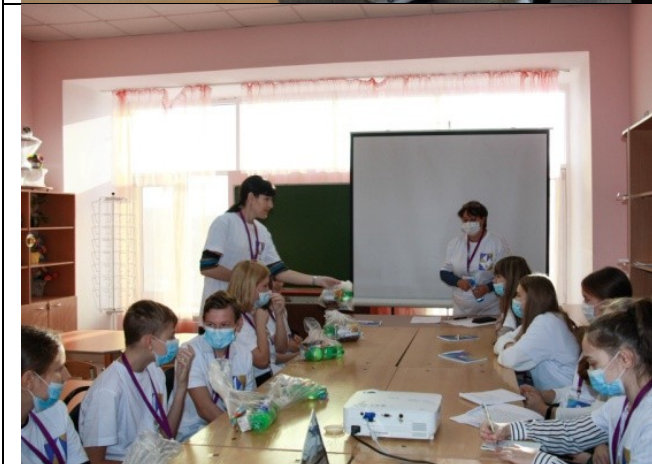
Фотография организации питания и питьевого режима

3. Было обеспечено изготовление и выдача каждому участнику и каждомулицу, привлекаемому к осуществлению деятельности, связанной с проведением 7-дневной каникулярной профориентационной школы с дневным пребыванием, комплектов расходных материалов и сувенирной продукции.