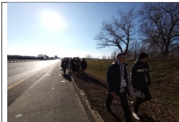
Фотография реализации профориентационной программы 3 день

И в завершении поездки, участники профориентационной смены приняли участие в акции «Чистые берега».