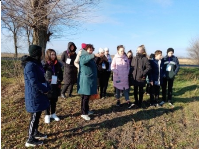
Фотография реализации профориентационной программы 6 день