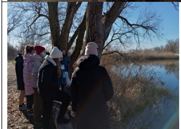
Фотография реализации профориентационной программы 3 день