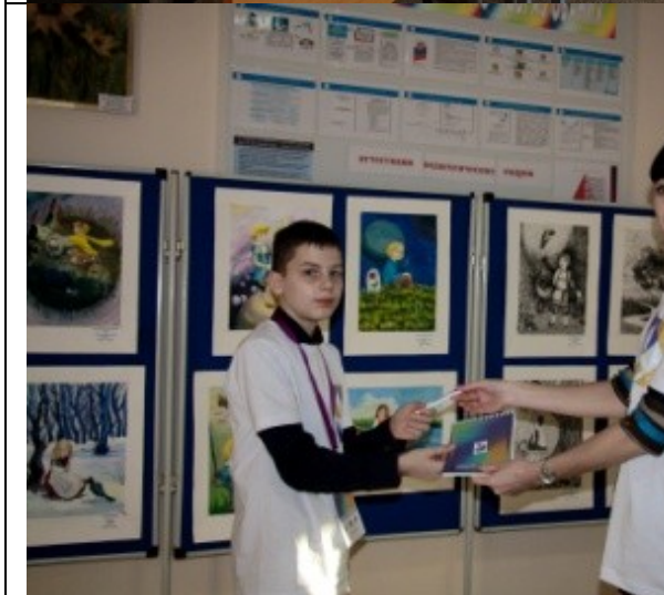
Фотография организации выдачи комплектов расходных материалов /сувенирной продукции