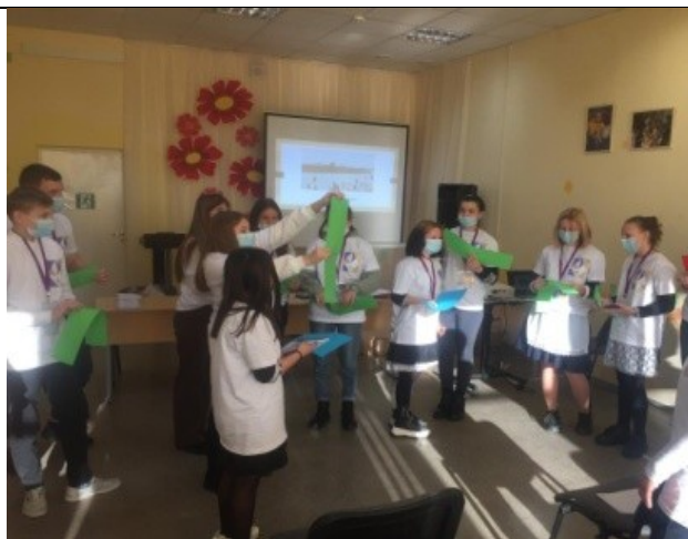
Фотография реализации профориентационной программы 1 день