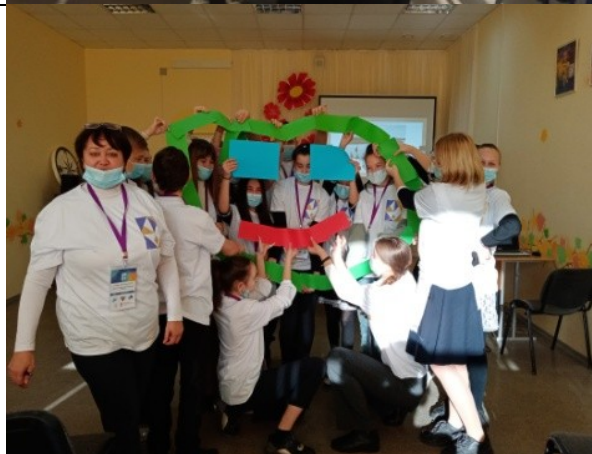
Фотография реализации профориентационной программы 1 день