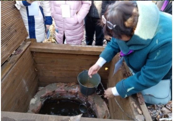
Фотография реализации профориентационной программы 4 день