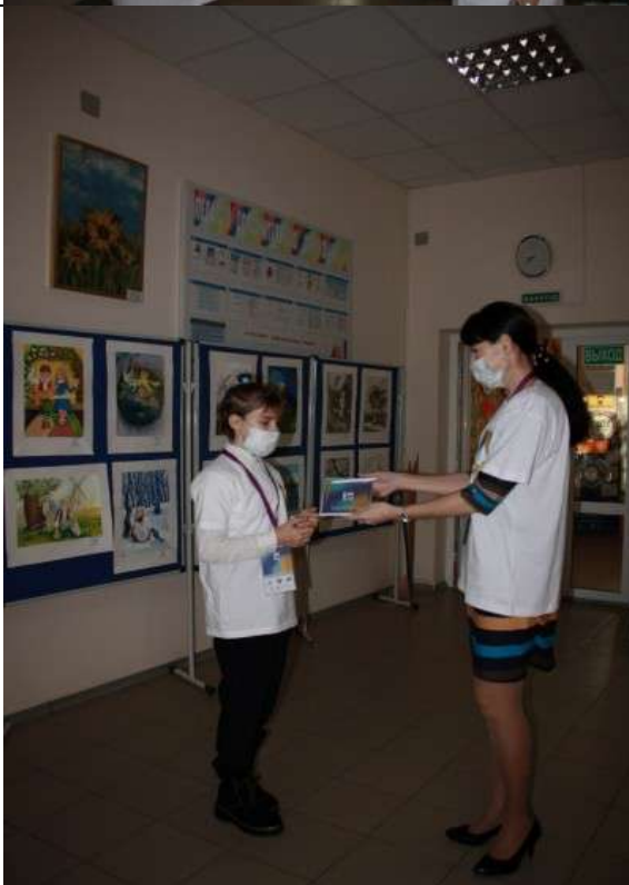
Фотография организации выдачи комплектов расходных материалов /сувенирной продукции