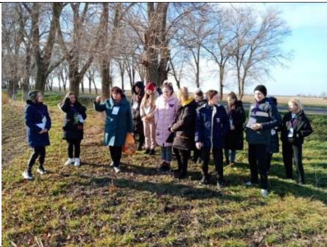
Фотография реализации профориентационной программы 6 день