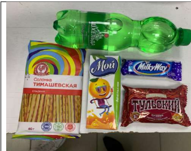
Фотография организации питания и питьевого режима

2. Участникам 7-дневной каникулярной профорientационной школы было обеспечено питание и питьевой режим: