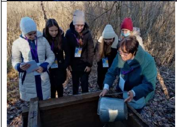
Фотография реализации профориентационной программы 4 день