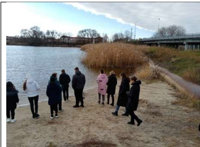
Фотография реализации профориентационной программы 6 день