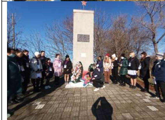
Фотография реализации профориентационной программы 2 день