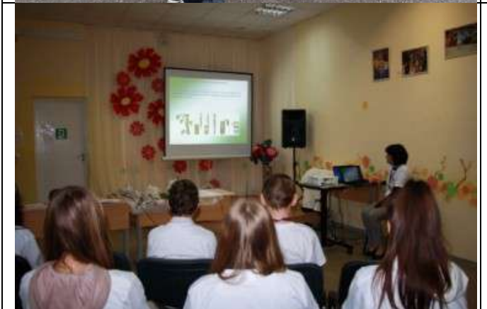
Фотография реализации профориентационной программы 5 день