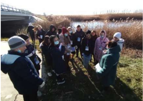
Фотография реализации профориентационной программы 3 день