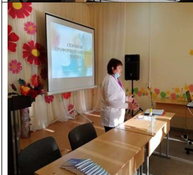
Фотография реализации профориентационной программы 1 день