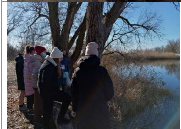
Фотография реализации профориентационной программы 3 день