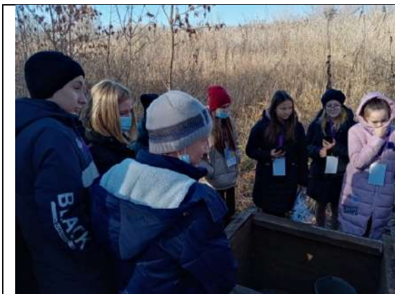
Фотография реализации профориентационной программы 4 день