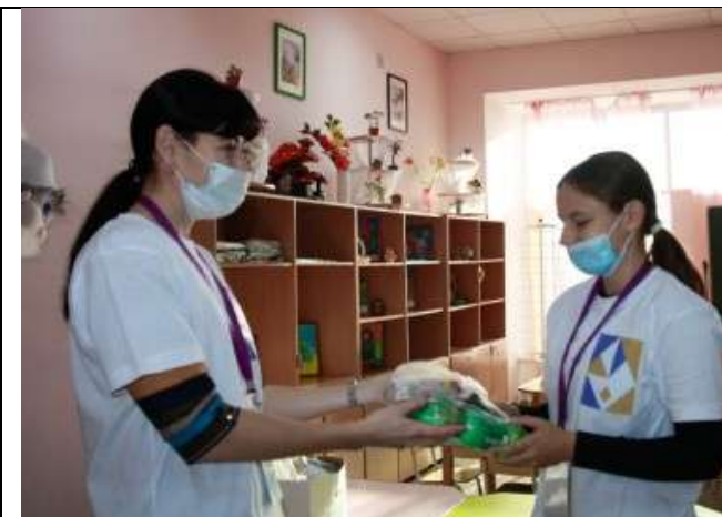
Фотография организации питания и питьевого режима