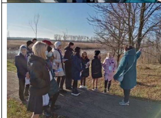
Фотография реализации профориентационной программы 2 день