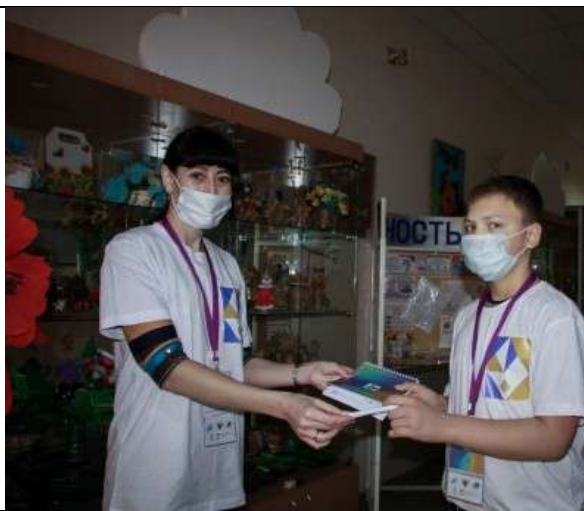
Фотография организации выдачи комплектов расходных материалов /сувенирной продукции