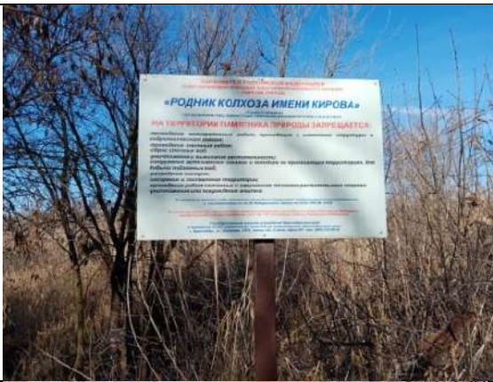
Фотография реализации профориентационной программы 4 день