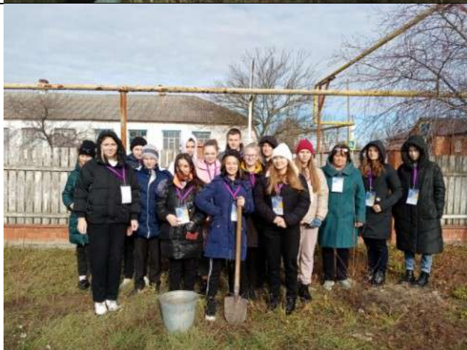
Фотография реализации профориентационной программы 6 день