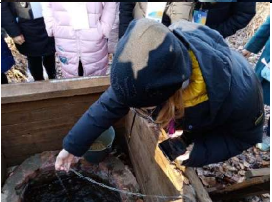
Фотография реализации профориентационной программы 4 день