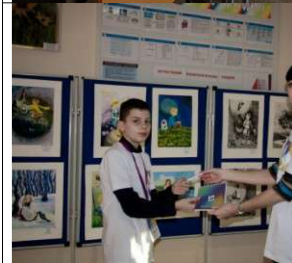
Фотография организации выдачи комплектов расходных материалов /сувенирной продукции