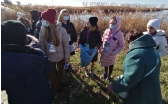
Фотография реализации профориентационной программы 3 день