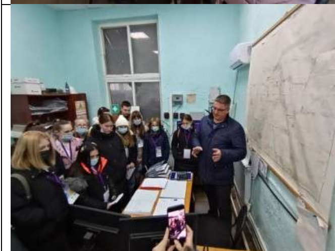
Фотография реализации профориентационной программы 5 день