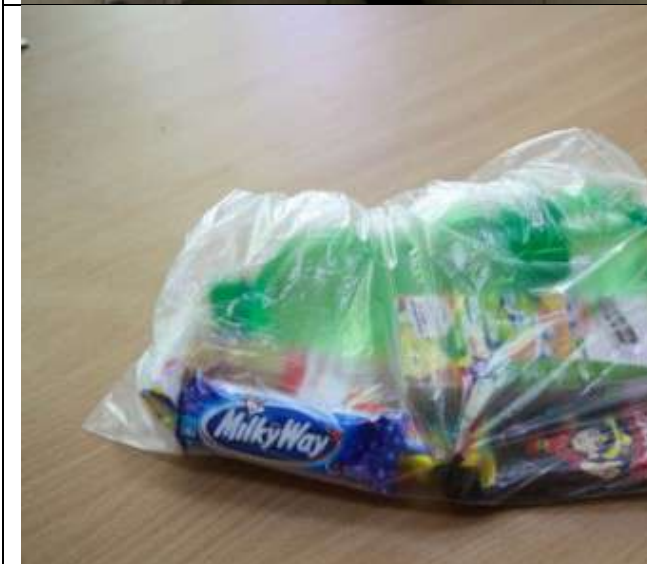
Фотография организации питания и питьевого режима