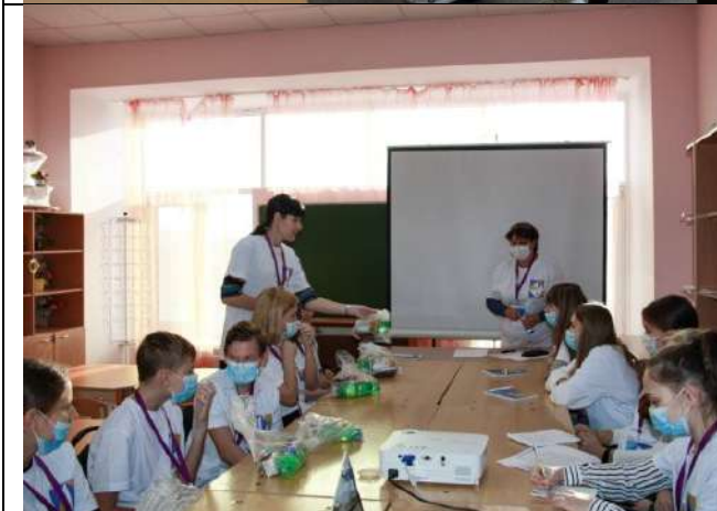
Фотография организации питания и питьевого режима

3. Было обеспечено изготовление и выдача каждому участнику и каждомулицу, привлекаемому к осуществлению деятельности, связанной с проведением 7-дневной каникулярной профориентационной школы с дневным пребыванием, комплектов расходных материалов и сувенирной продукции.