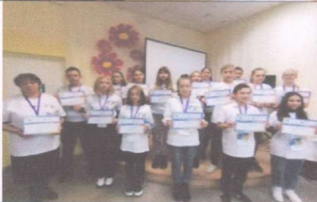
Фотография реализации профориентационной программы 7 день