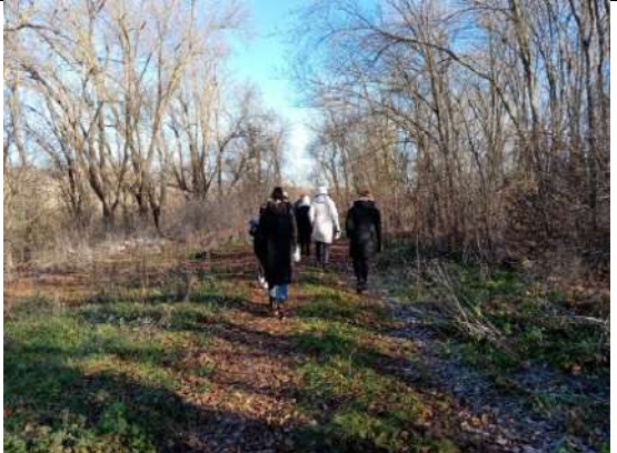
Фотография реализации профориентационной программы 4 день