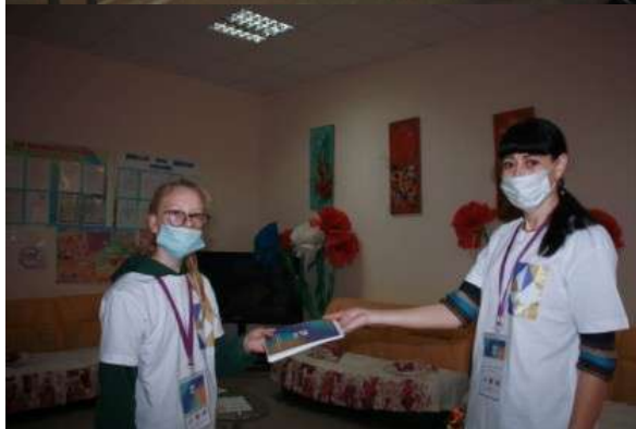
Фотография организации выдачи комплектов расходных материалов /сувенирной продукции