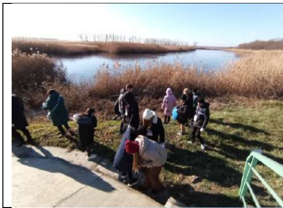
Фотография реализации профориентационной программы 3 день