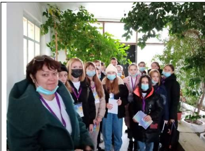
Фотография реализации профориентационной программы 5 день