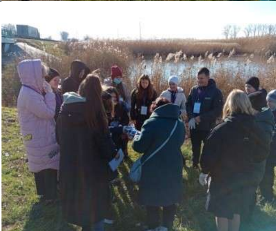
Фотография реализации профориентационной программы 2 день