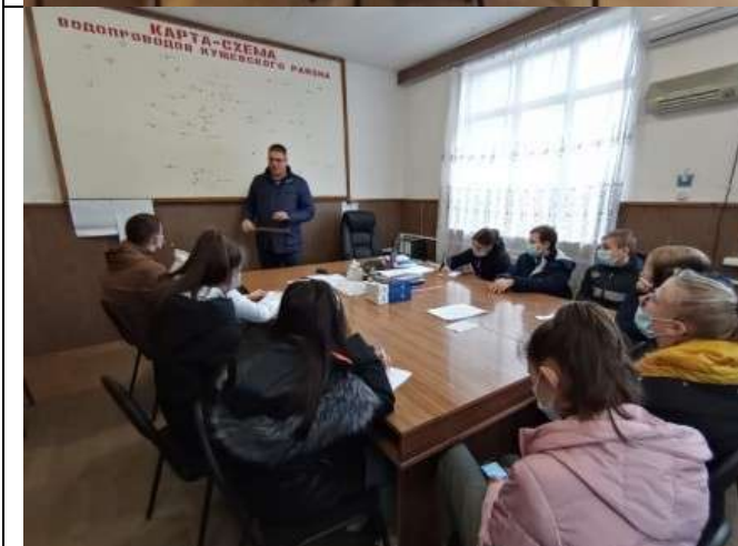
Фотография реализации профориентационной программы 5 день