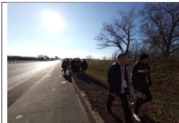
Фотография реализации профориентационной программы 3 день

И в завершении поездки, участники профориентационной смены приняли участие в акции «Чистые берега».