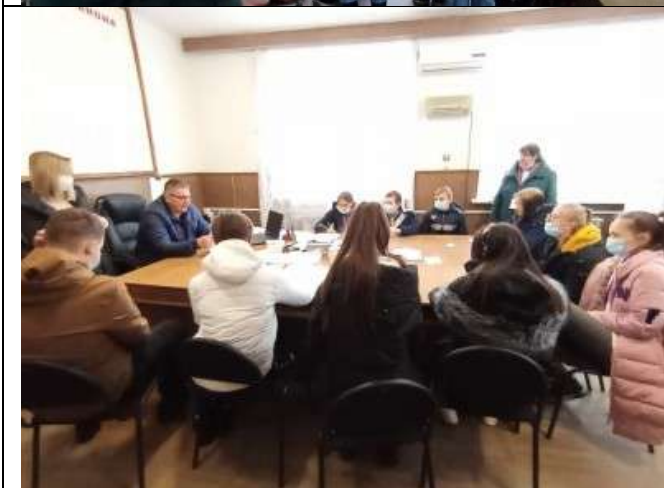
Фотография реализации профориентационной программы 5 день