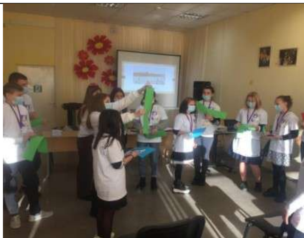
Фотография реализации профориентационной программы 1 день