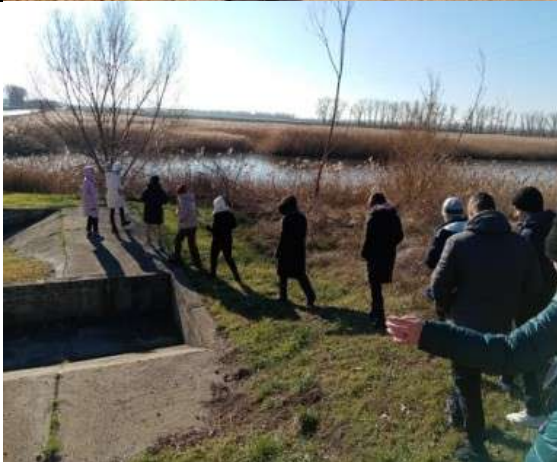
Фотография реализации профориентационной программы 2 день