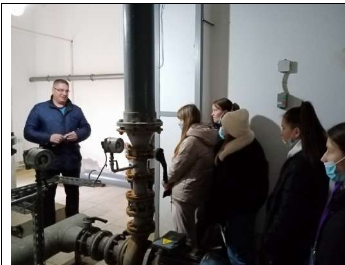
Фотография реализации профориентационной программы 5 день