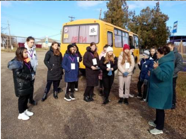
Фотография реализации профориентационной программы 6 день