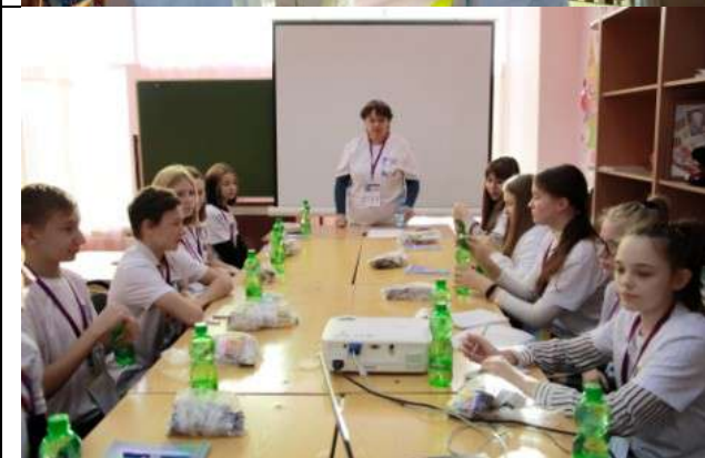
Фотография организации питания и питьевого режима