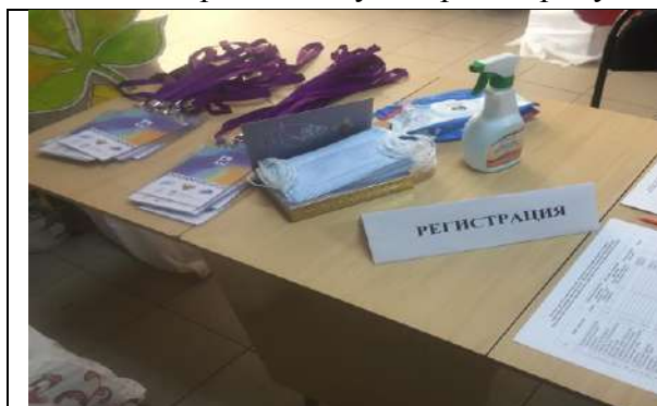
Фотография организации выдачи комплектов расходных материалов /сувенирной продукции

3. Было обеспечено изготовление и выдача каждому участнику и каждомулицу, привлекаемому к осуществлению деятельности, связанной с проведением 7-дневной каникулярной профориентационной школы с дневным пребыванием, комплектов расходных материалов и сувенирной продукции.