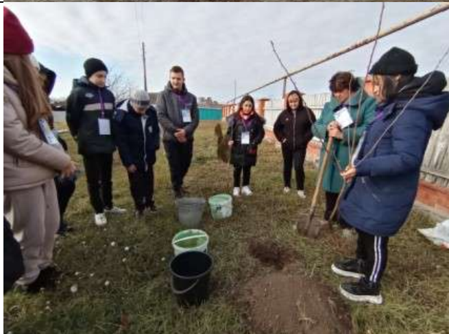
Фотография реализации профориентационной программы 6 день