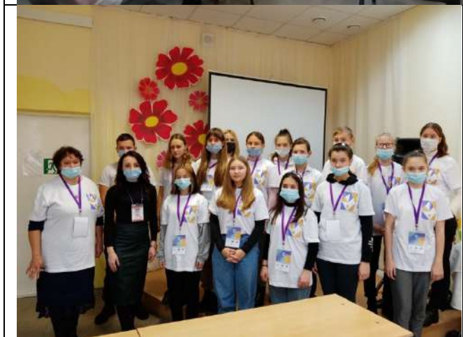
Фотография реализации профориентационной программы 7 день