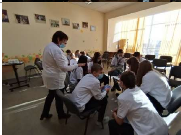
Фотография реализации профориентационной программы 1 день