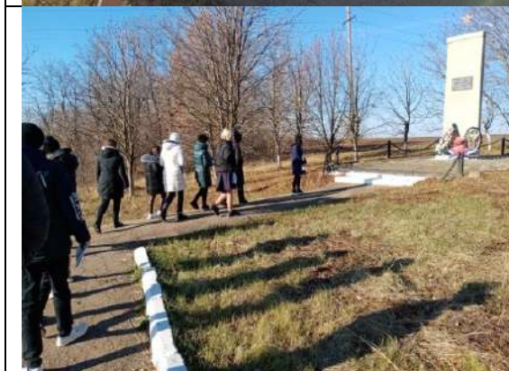
Фотография реализации профориентационной программы 2 день