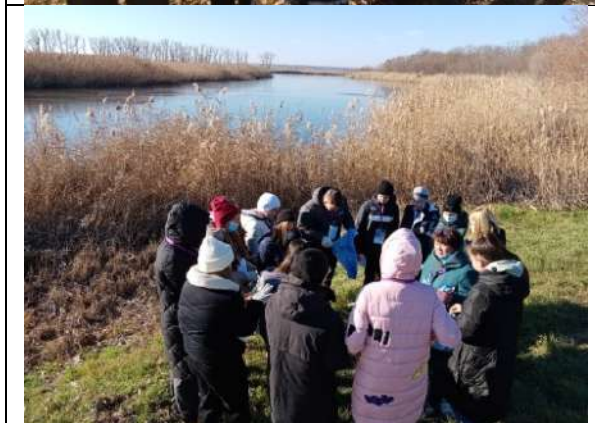
Фотография реализации профориентационной программы 3 день