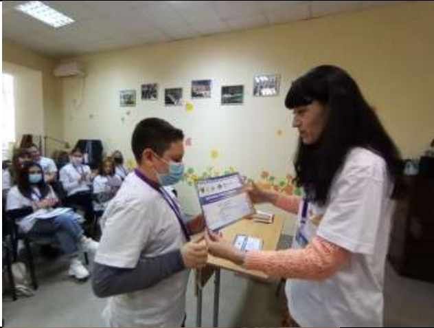
Фотография реализации профориентационной программы 7 день