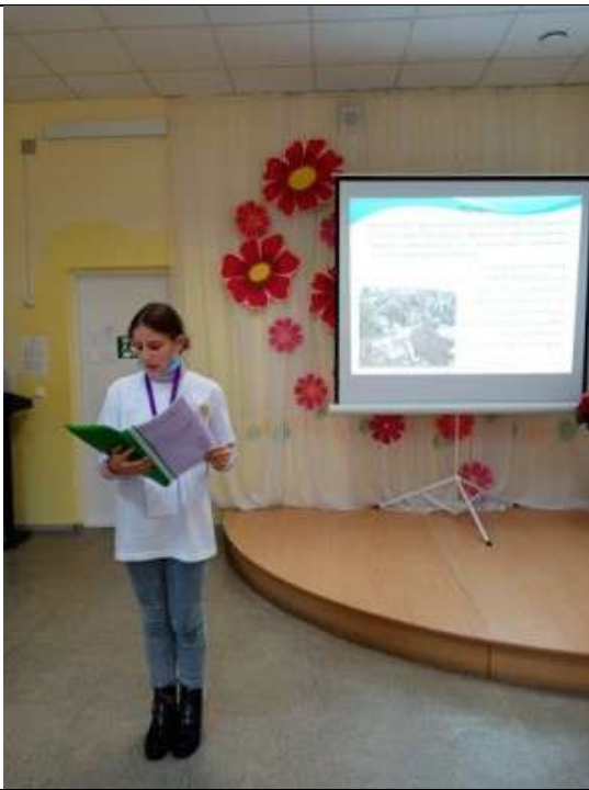
Фотография реализации профориентационной программы 7 день