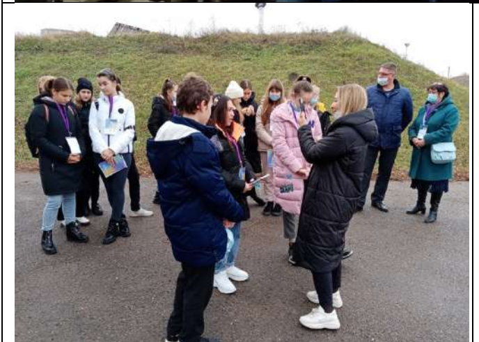
Фотография реализации профориентационной программы 5 день