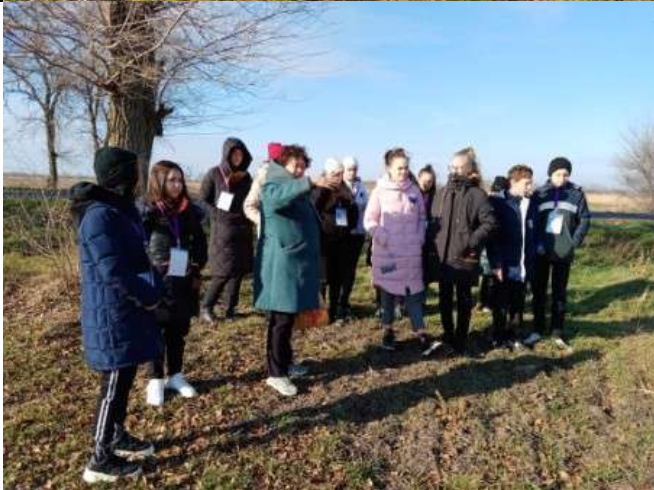
Фотография реализации профориентационной программы 6 день