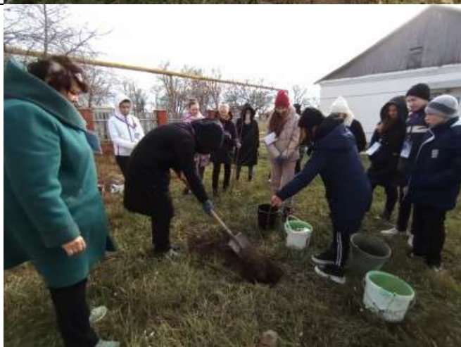
Фотография реализации профориентационной программы 6 день