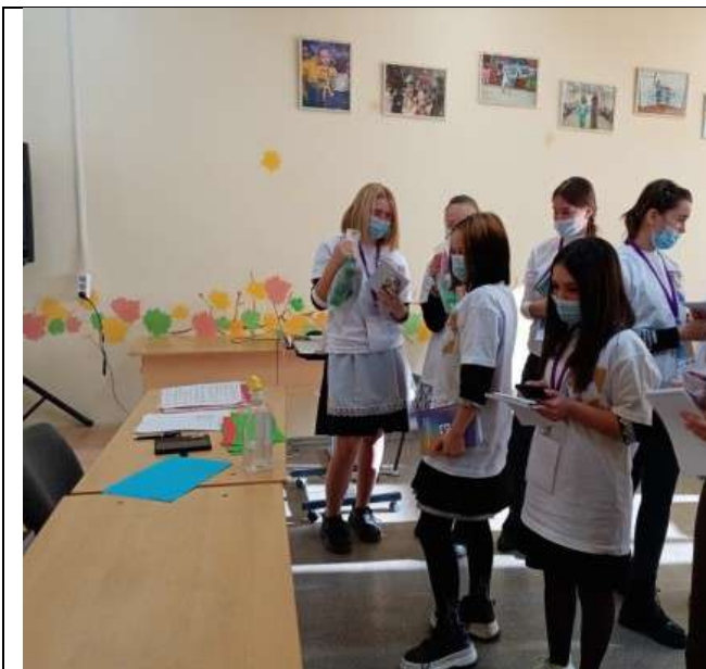
Фотография организации питания и питьевого режима