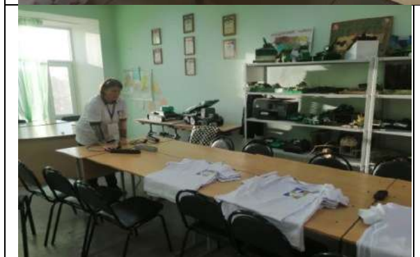
Фотография организации выдачи комплектов расходных материалов /сувенирной продукции