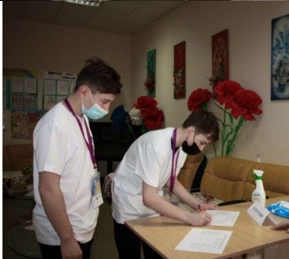
Фотография организации выдачи комплектов расходных материалов /сувенирной продукции