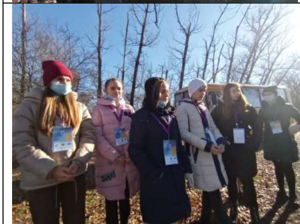
Фотография реализации профориентационной программы 3 день