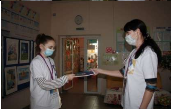
Фотография организации выдачи комплектов расходных материалов /сувенирной продукции