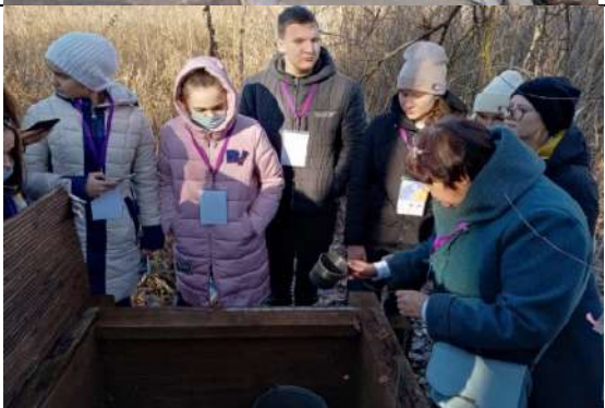
Фотография реализации профориентационной программы 4 день