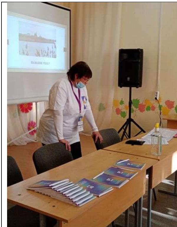
Фотография организации выдачи комплектов расходных материалов /сувенирной продукции