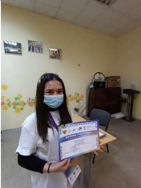
Фотография реализации профориентационной программы 7 день