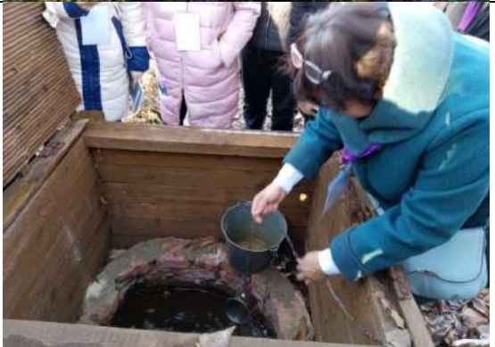
Фотография реализации профориентационной программы 4 день