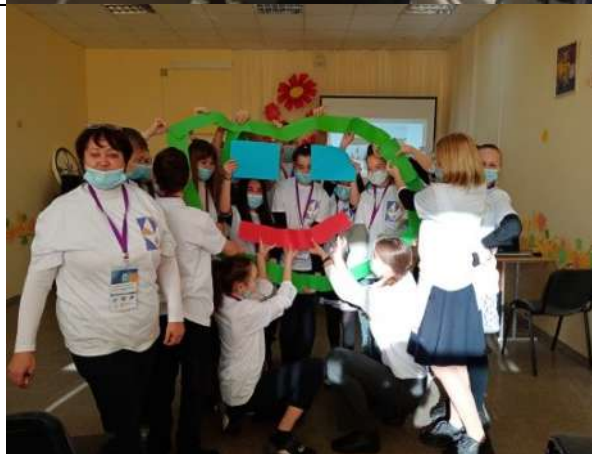
Фотография реализации профориентационной программы 1 день