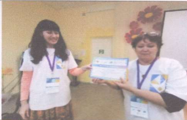
Фотография реализации профориентационной программы 7 день