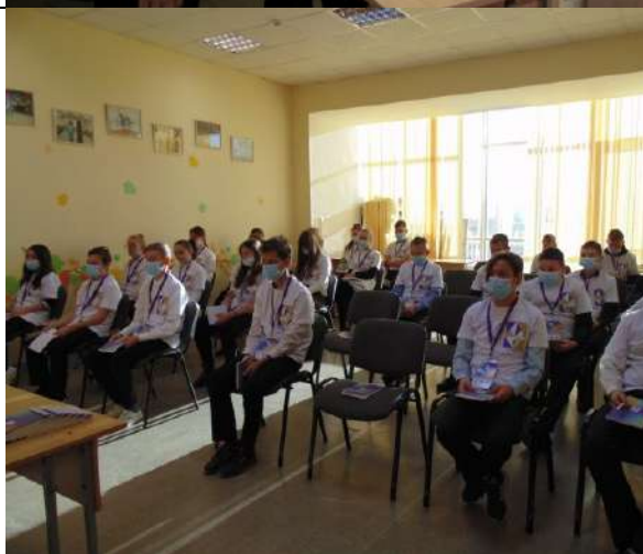
Фотография организации выдачи комплектов расходных материалов /сувенирной продукции