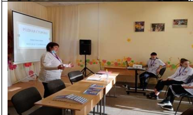
Фотография реализации профориентационной программы 1 день