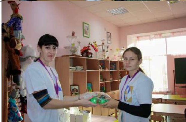
Фотография организации питания и питьевого режима