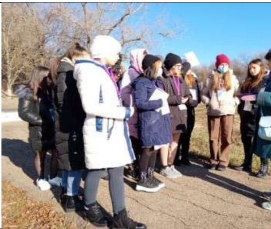
Фотография реализации профориентационной программы 2 день