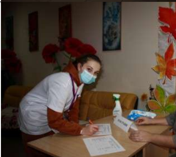
Фотография организации выдачи комплектов расходных материалов /сувенирной продукции